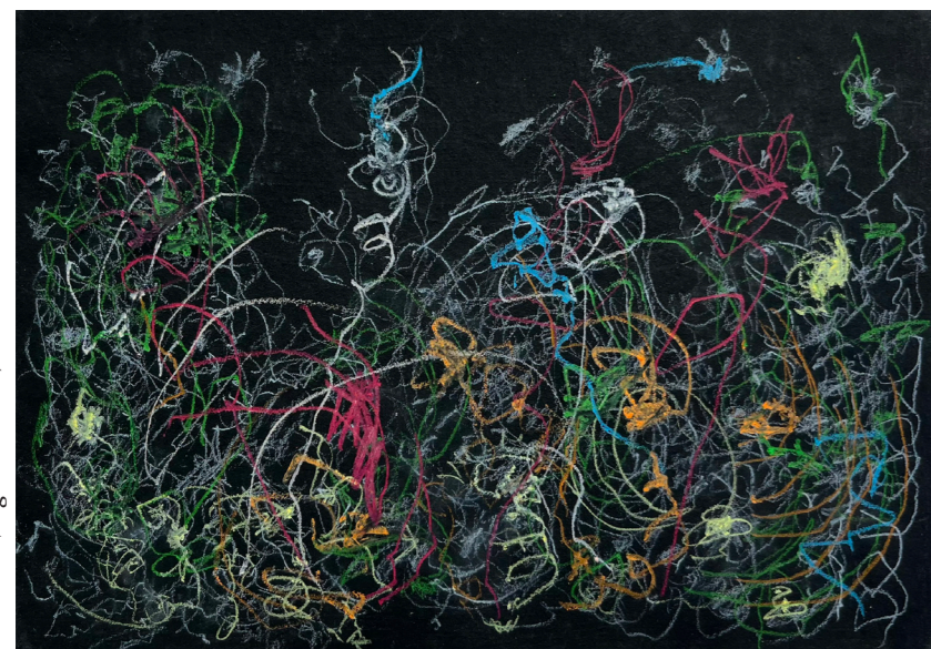
Chris Neate, Light Within Us , 2023